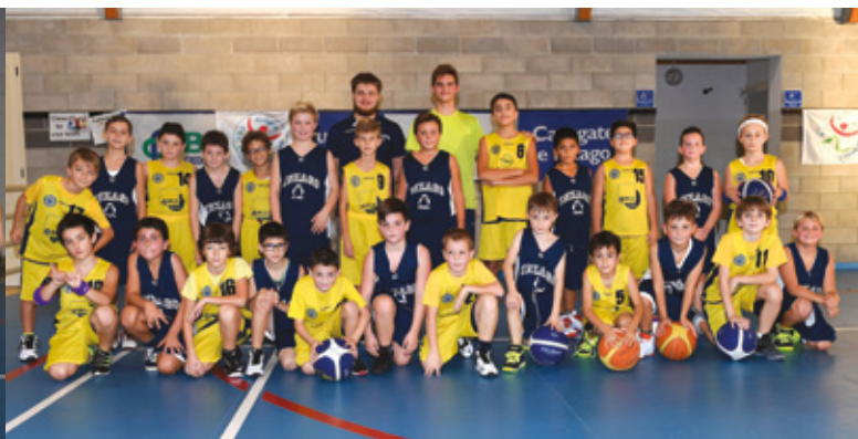
Le formazioni che hanno disputato le finali del Torneo 2016. A sinistra: Gerardiana Basket Monza (in rosso) e CSA Basket Agrate Brianza (in giallo). A destra: Forze Vive Inzago (in blu) e ASD OSGB Gessate (in giallo).